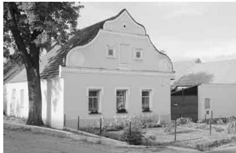
Branišov, usedlost čp. 29.

Osada vznikla nejspíše během vrcholné kolonizace ve 13. století a dostala název podle lokátora nebo majitele Braniše. Poprvé se ve připomíná roku 1391. Ve středověku náležela část Branišova s několika poddanskými usedlostmi a krčmou k nedaleké tvrzi Doubíčku; ta byla původně šlechtickým majetkem a roku 1548 ji i s Branišovem koupilo město České Budějovice. Tehdy tu hospodařili sedláci Dvořák, Blažek, Šmahl, Lokapaur a Tkadlec. Menší část vesnice patřila na