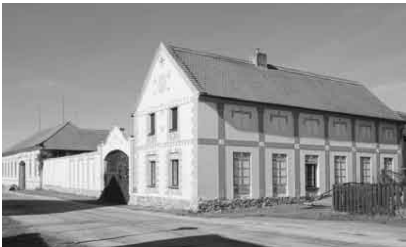
Bavorovice, usedlost čp.59.