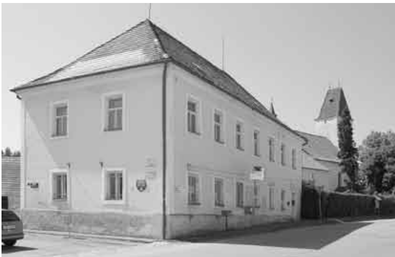
Boršov nad Vltavou, stará školní budova a kostel.

Matice školská také českou obecnou v nově postavené budově čp. 16. Matiční školu převzal roku 1894 stát a v roce 1898 se přestěhovala do objektu bývalé německé školy, která byla přemístěna do Homol. V Boršově pak zůstala v letech 1898–1918 jen německá expozitura v čp. 15. Roku 1921 došlo ke sloučení české obecní školy s trojtřídní školou v Poříčí, až do roku 1975 se vyučovalo v obou budovách, pak již jen v poříčské. V letech 1939–1945 zde znovu působila německá obecná škola. – Mateřská škola existovala již v letech 1939–1940, obnovena 1945 a znovu 1959, novou budovu získala 1983.