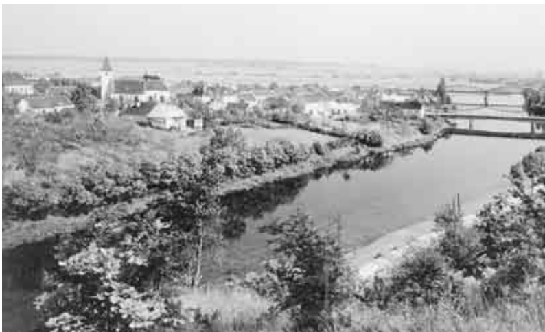
Boršov nad Vltavou, pohlednice z doby kolem roku 1930.