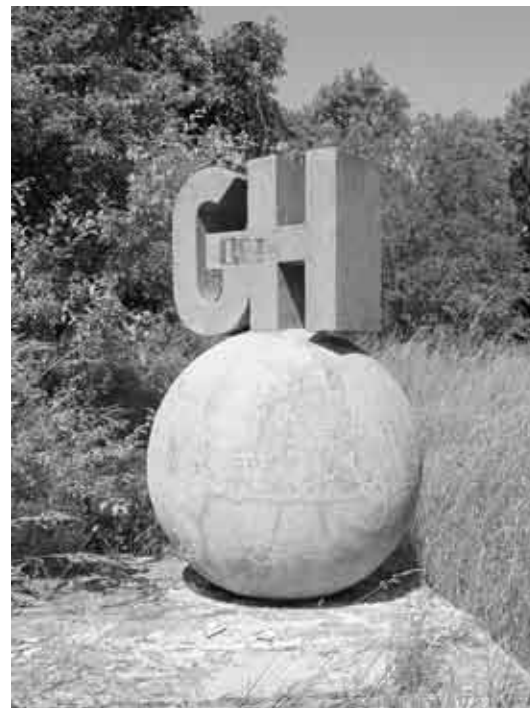
Boršov nad Vltavou, pomník Gustava Habrmana.

Památky: Nad okolní zástavbu ční věž kostela sv. Jakuba Většího , který vznikl již před rokem 1290. Dosud dochované gotické kněžiště bylo vystavěno v poslední čtvrtině 14. století, ale dnešní pozdně gotickou podobu dala kostelu přestavba z let 1493–1496, kdy také vyrostla věž. Severní předsíň datuje letopočet 1834. Interiér je zdoben pozdně gotickými malbami, např. sv. Kryštofa na