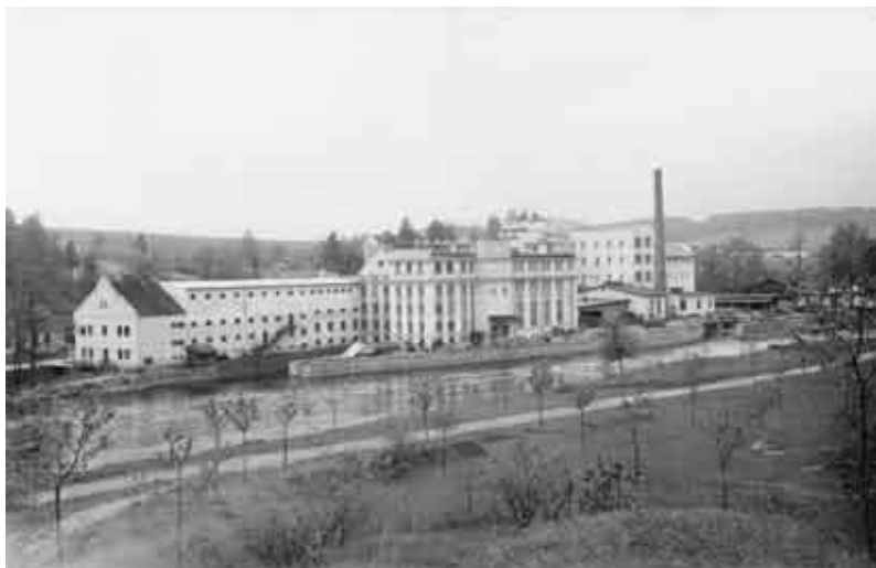
Zátkův mlýn u Březí na pohlednici (kolem 1930).

Pod Březím byl na základě císařského povolení z roku 1599 postaven dřevěný most, který postupně zchátral a zanikl; obnovy se dočkal v roce 1727 (přes nemalé protesty Budějovických) a existoval pak až do 19. století.