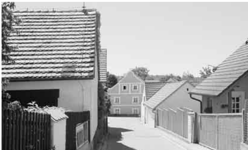
Adamov, průhled k radnici.

zemědělci, například roku 1824 mělo ze 70 domů jen 5 zemědělskou půdu. V 18. a 19. století proběhla řada pokusů o obnovu těžby stříbra, ale vždy bez většího úspěchu. Počet obyvatel Adamova od 18. století rostl a stavěly se nové chalupy, většinou na rozdělených zahradních parcelách, takže se zástavba spíše zahušťovala, než aby expandovala do okolí (k tomu neměla prostorové podmínky). Po roce 1860 došlo k postupnému počestění Adamova, od roku 1884 vznikaly především české spolky: nejprve Občanská beseda, roku 1889 Matice školská, roku 1897 Dělnická beseda. Obyvatelstvo tvořili vedle měšťanů, živících se řemeslem, stále více dělníci a do začátku 20. století také horníci. S definitivním zánikem zdejších dolů (1908) došlo ke zhoršení hospodářské situace a před první světovou válkou se zastavil růst počtu obyvatel. Z místních řemesel vynikalo zejména krajkářství a také nožířství – „adamovské kudličky“ prosluly široko daleko. Celá staletí také Adamovští řešili problémy s vodou, již měli na svých pozemcích nedostatek a navíc se ztrácela v podzemních prostorách bývalých důlních děl; vlastní vodovod byl uveden do provozu teprve roku 1914.