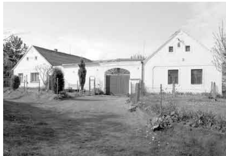
Borovnice, usedlost čp. 23.