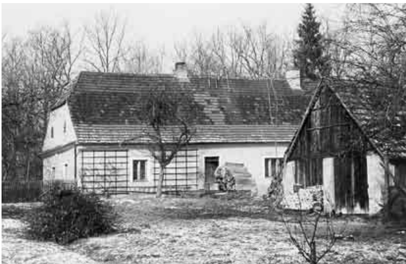
Hájovna a bývalý domek cihláře u Borku.

šlo ale o pojmenování lesa, doložené již k roku 1489. Pro vývoj pozdější vsi se stala určujícím prvkem trasa nové pražské silnice, vytyčené a postavené v letech 1753–1755 – silnice do té doby probíhala západněji přes Kněžské Dvory a Hrdějovice, takže les Borek obcházela. Stavbou přeložky ovšem přišla o své zákazníky schwarzenberská zájezdní hospoda „Na slámce“ nad Hrdějovicemi, a Schwarzenbergové proto vzápětí uvažovali o přesunutí hospody, což se uskutečnilo teprve o šest desetiletí později. Kolem přelomu 18. a 19. století vznikla v lese poblíž nové silnice nejprve schwarzenberská hájovna „Na překážce“, která se nacházela v horní části nynější obce Borku (později dostala popisné číslo 9). Nedaleko fungovala ještě panská cihelna, patřící k chyňavskému dvoru a doložená již koncem 16. století. Samotná osada začala na nynějším místě vznikat až počátkem 19. století, ale nikterak plánovitě: roku 1805 byl na vrchnostenském pastvišti u silnice postaven první domek (čp. 8) a v letech 1812–1816 další tři. Tyto nejstarší budovy stály okolo silnice nad nynější návsi. Poblíž nich vyrostla schwarzenberská zájezdní hospoda. Pro nemajetnost obyvatel, kteří neměli žádné pozemky a byli dokonce osvobozeni od placení desátku, se místu začalo říkat „Bída“; označení je