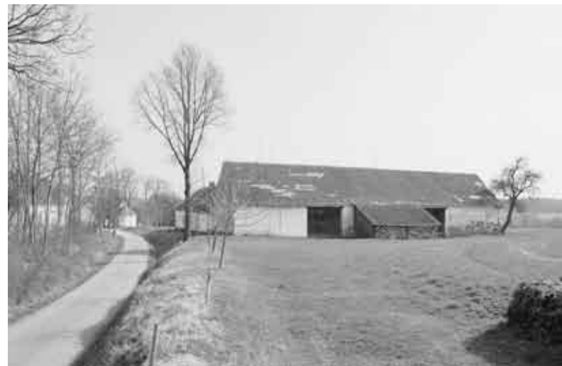
Červený Újezdec, jižní okraj vsi.